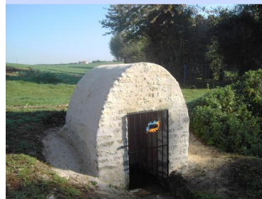
Les rivières et les ruisseaux Les douves Les étangs et les marais asséchés